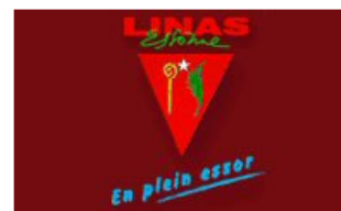
La Mairie de LINAS